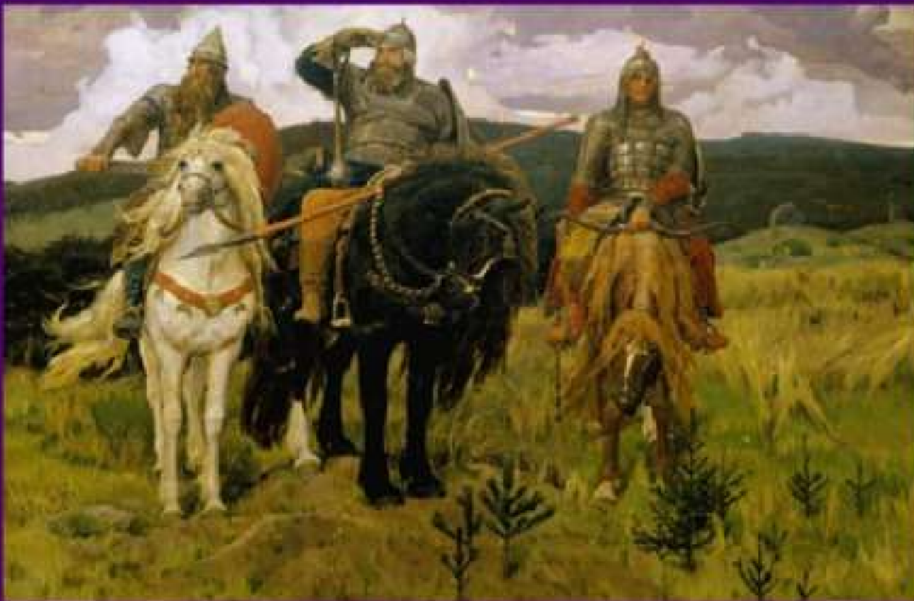
Виктор Васнецов «Богатыри»